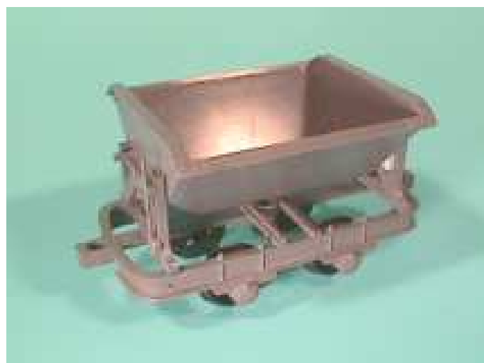
Fertige Kipplore noch ohne Kupplung

Als erster Arbeitssgang werden die Arretierhebel in die beiden Löcher gesteckt und mit Sekundenkleber oder Plastikkleber (zB. Fallert) in den Bohrungen fixiert. Die fertigen Muldenstützen werden in das Fahrgestell eingesteckt, dabei die Nasen in die Bohrungen des Fahrgestells einrasten lassen. Nach dem Ausrichten werden die Stützen mit Kleber verklebt. (Bitte wenig Kleber verwenden)