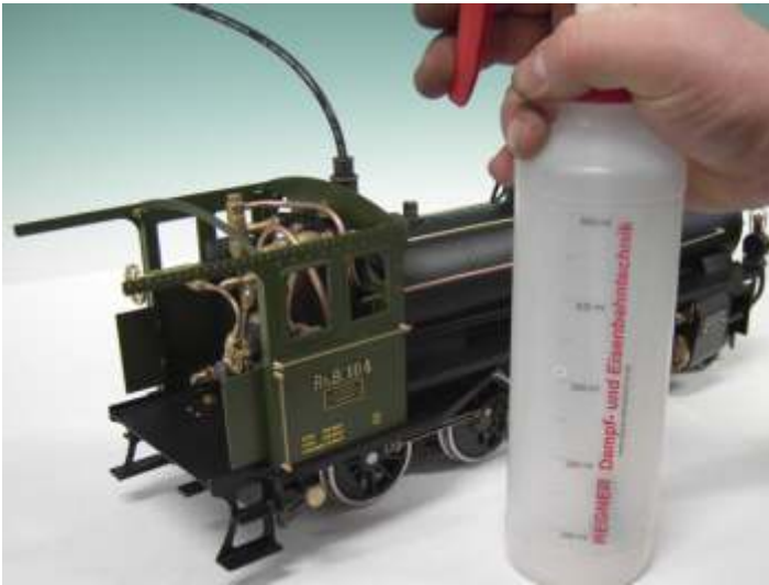
Mit Druckflasche über das Speiseventil einfüllen